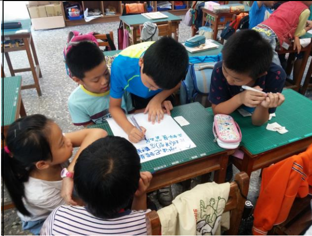
照片說明：語文活動練習，小組分享報告組裝短文。