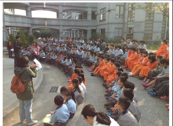
國語文口語表達活動